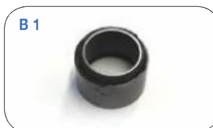
Supporto elastico per carburatore. Silent block for carburettor E-F.