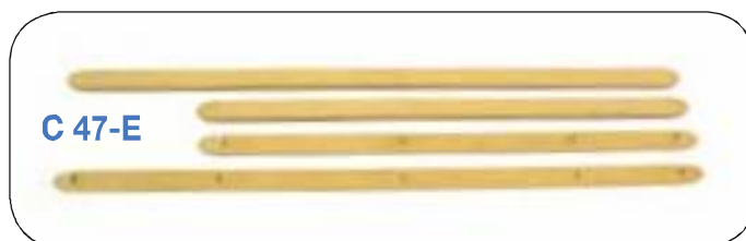
Serie listelli pedana in gomma con anima in metallo 125 E. Rubber floor strips with metal insert 125 E.