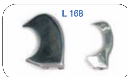
Coperchietti comandi al manubrio. Pairs chrome plates for handlebar E-F.