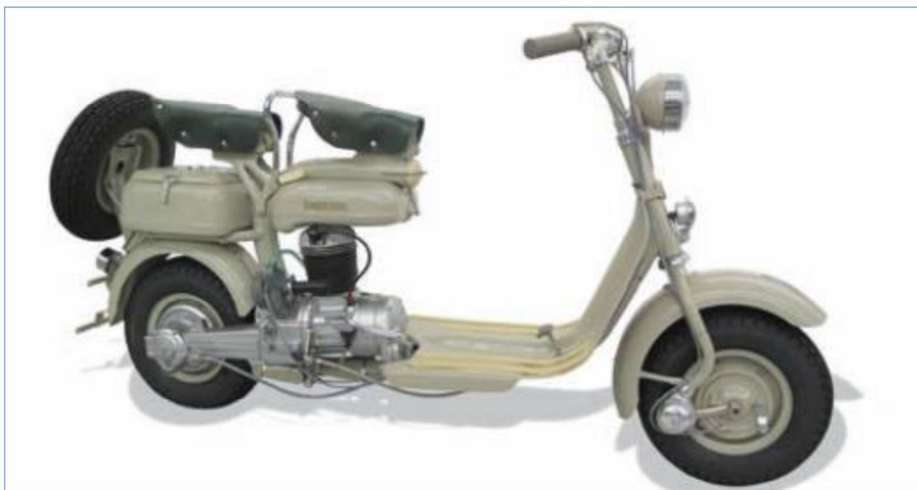
Lambretta 125 F prima versione 1954. Lambretta 125 F 1954 first version.