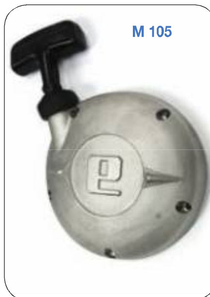
Gruppo completo per avviamento a strappo 125 E. Complete hand start mechanism 125 E.