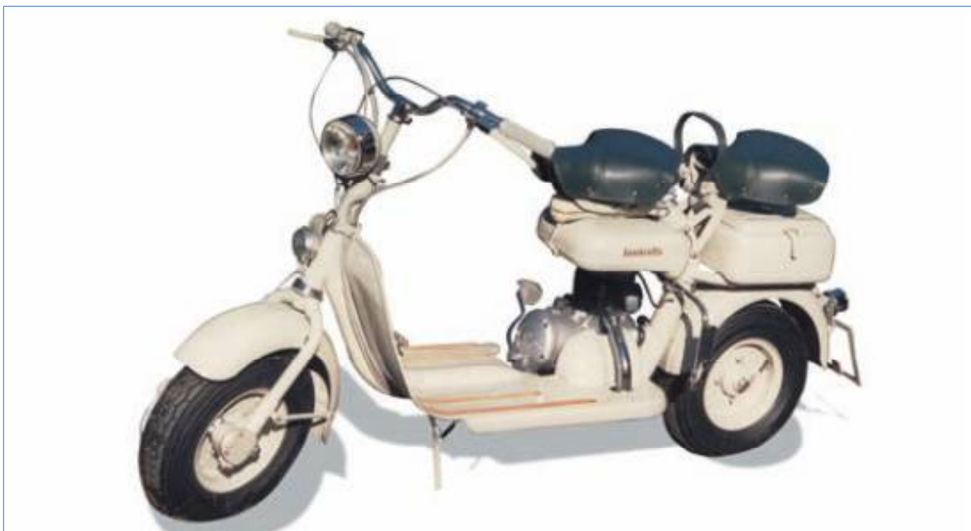
Lambretta 125 F seconda serie 1955.

Second version: all in the same Sand-Beige or Light-Grey colour.