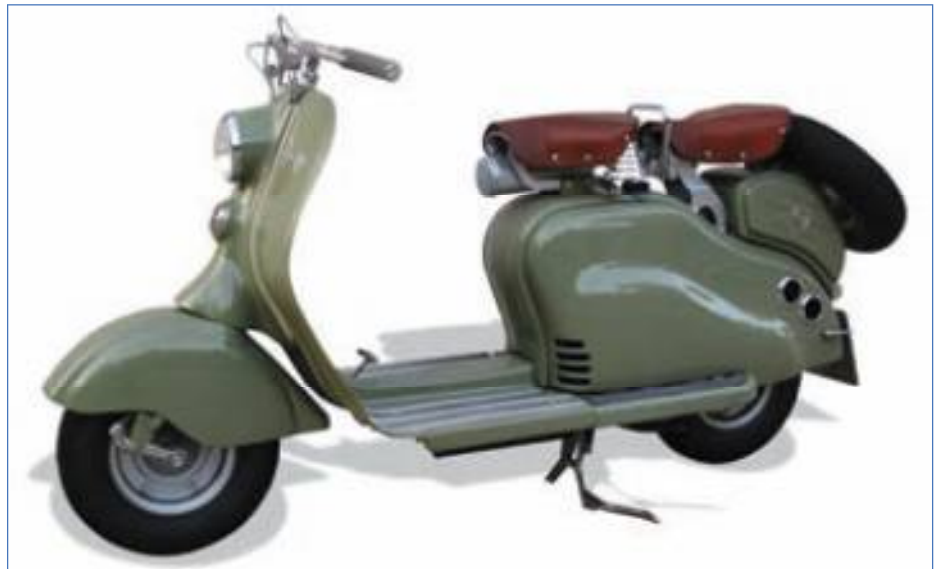
Lambretta 125 LC prima versione 1950. Lambretta 125 LC 1950 first version.