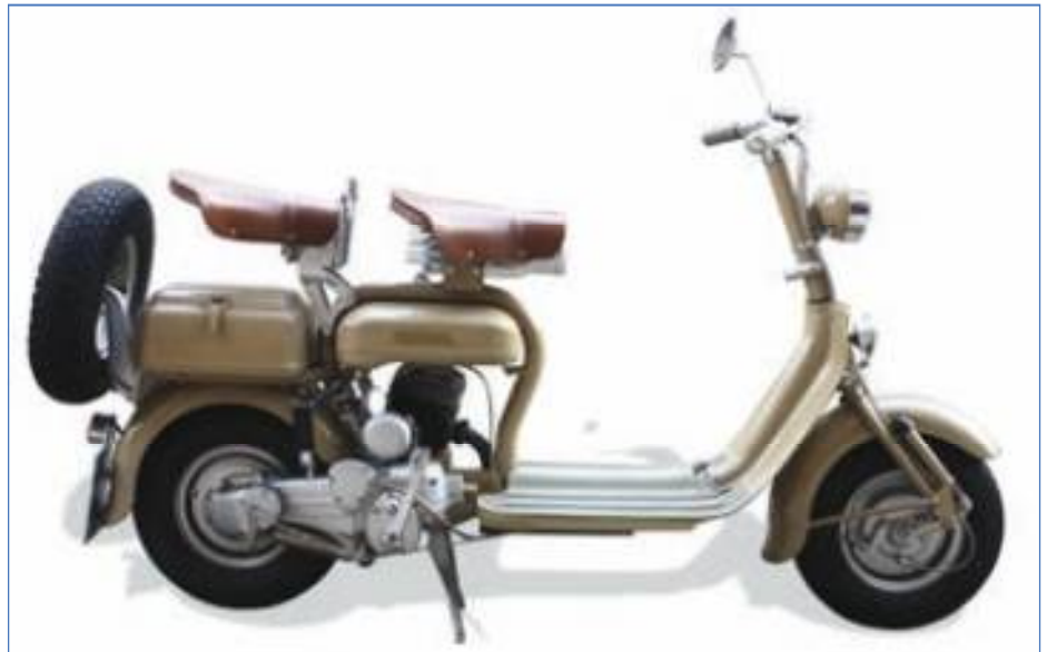
Lambretta 125 C seconda versione 1951. Lambretta 125 C second version 1951.

Vale per entrambi i modelli: I carter motore e il filtro aria sono sempre verniciati color alluminio Fiat 690.