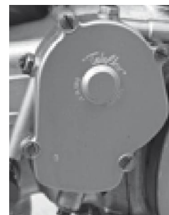
Scatola cambio I a serie Gearbox first series..

Valid for both models: the crankcase and the air filters are always painted in Aluminium colour FIAT 690.